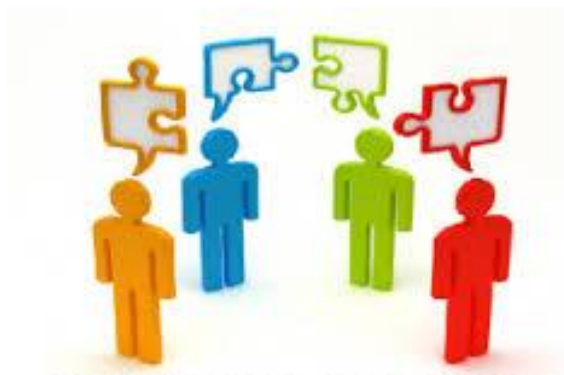
KONSULTACJE Z DORADCĄ ZAWODOWYM

To spotkanie lub kilka spotkań indywidualnych klienta (osoby bezrobotnej/poszukującej pracy) z doradcą zawodowym, podczas których wspólnie pracują oni nad wypracowaniem rozwiązań.